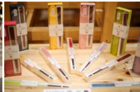
商品だけではなく、ライフスタイルごと紹介することで、日本商品への購買意欲を高める効果も。