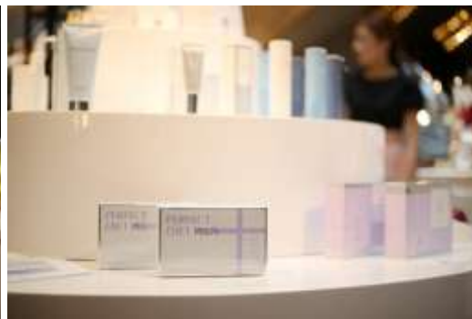
日本の最新のコスメや、トイレタリー商品が並びます。