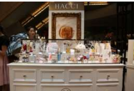
オフラインイベント初出展のはちみつコスメブランド「HACCI」