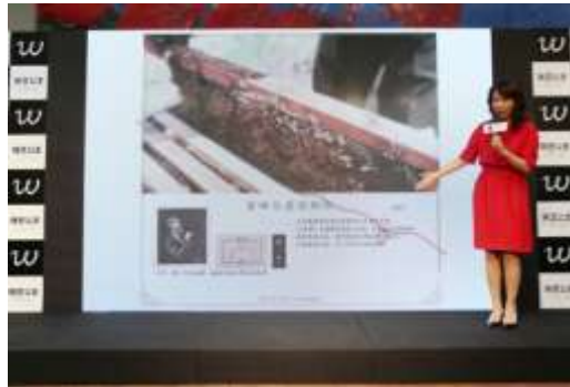
メディア向け発表会の様子