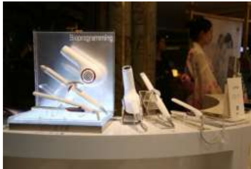
体験型の展示方法で、商品の良さをしっかりお伝えしております。