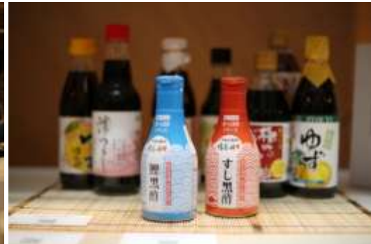
ポン酢や、すし酢など、日本独自の食文化は、実際に体験していただくことでより理解を深めていただきました。