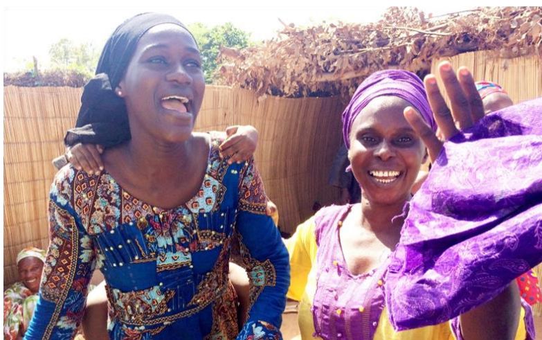
ガイドブック表紙