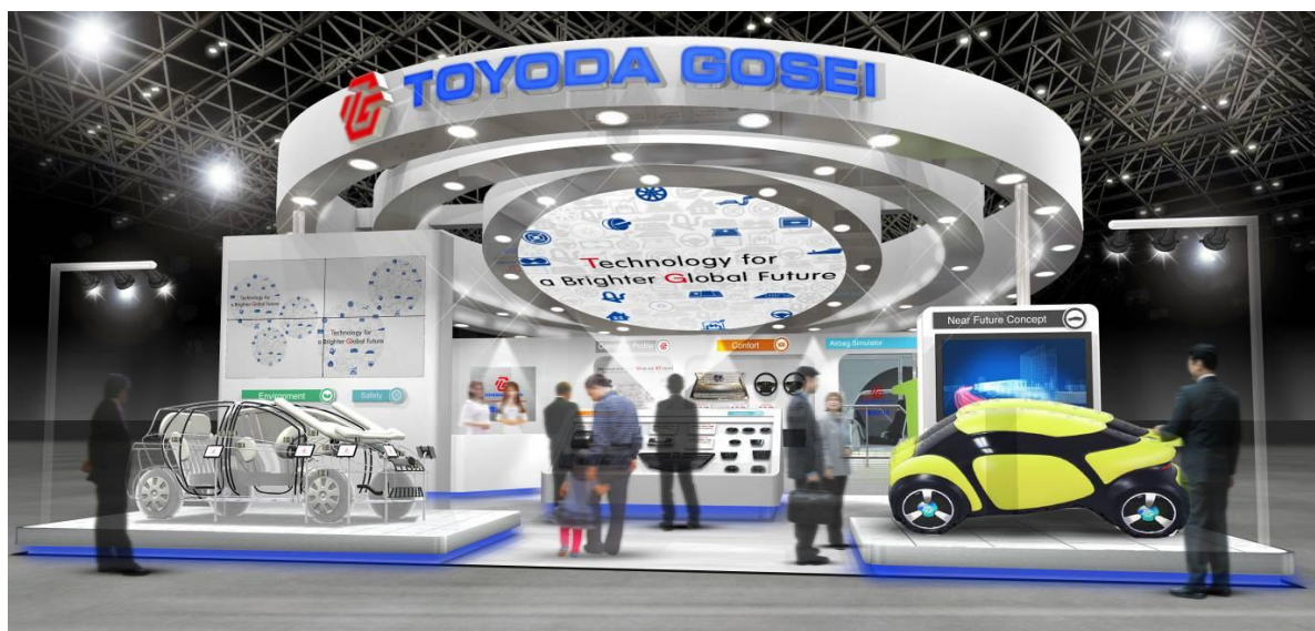
ブース全景 [イメージ]

「～Technology for a brighter Global future～ ゴム・樹脂の高分子技術とLEDで世界にうれしさを届けたい」をテーマに、安全で環境にやさしく快適なクルマづくりに貢献する豊田合成の幅広い製品・技術を紹介します。