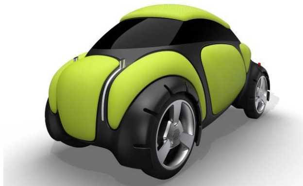
エアバッグカー”Flesby (フレスピー)” [イメージ]