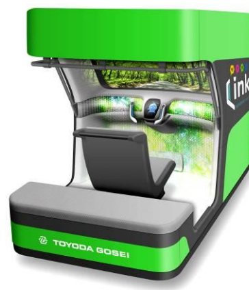
ツナガルコックピット”Link” [イメージ]