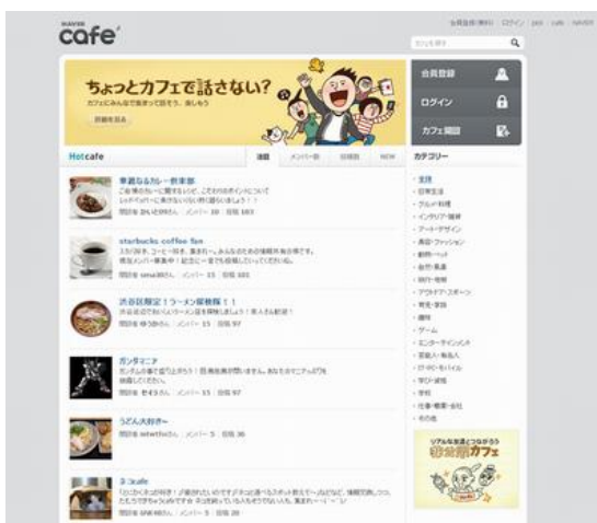
NAVER cafe TOP イメージ

さらに、家族や親しい友人などに限定してコミュニケーションを取りたい場合は「非公開 cafe」を作成することもできます。「非公開 cafe」独自機能として、Word や Excel などの「ファイル共有機能」を搭載しており、セミナー・勉強会の参加メンバー同士で資料を共有する時などにも利用することができます。