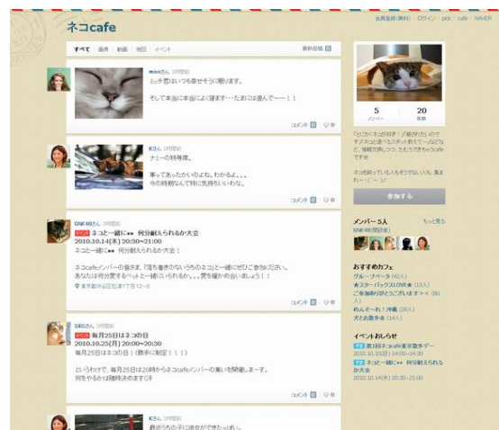
カフェ TOP イメージ

なお、近日中にモバイル、iPhone アプリも対応予定。GPS による現在地情報を利用して、周辺の施設や飲食店に関する cafe をプッシュ通知する新機能の導入も検討しています。