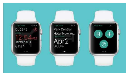
画像3: 腕時計型ウェアラブル端末利用イメージ