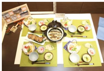
優勝のお料理：「栃木の味覚たっぷり栄養満点ごはん！！」