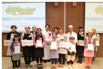
全国大会へ出場される参加者