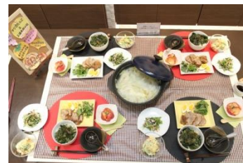
準優勝のお料理：「愛情いっぱい！！三浦半島からの贈り物」