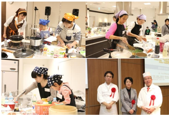
入賞者の調理の様子と審査員