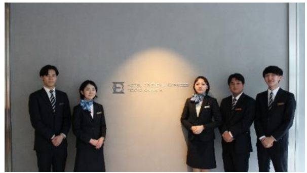
考案したチーム(5名)

2022年4月に当ホテルスタッフより日本工学院専門学校 の1年生45名へコンセプトルーム制作についての講義を 行い、「ターゲットをZ世代～20代後半、大田区(蒲田)に あるホテルだからこそできる部屋」など、本年度の企画の 背景や目的、条件を説明。その後、学生10チームは、コン セプトやペルソナ、装飾、販売までのスケジュールを組み 入れた企画立案を行い、7月にプレゼンテーションを実施 しました。9月に10チームの中からホテルコースの学生が 企画・考案した「お風呂ルーム」の採用に決定。 学生たちは、ホテルスタッフと打合せを重ね、運営方法、 アイテムの購入、客室の装飾、写真撮影、広報活動に至 るまで実際にホテルスタッフが行う業務も体験しました。