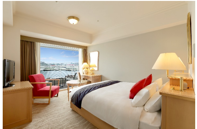
▲スタンダードダブルイーストビュー (客室一例)