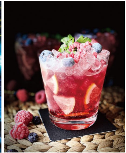
▲「メヤメヤ」オリジナルカクテル