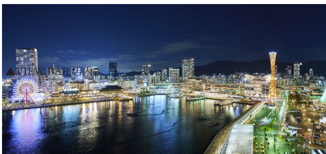
▲VIEW BAR テラス席からの夜景