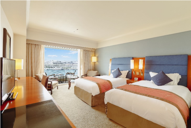
▲スタンダードツイン イーストビュー (客室一例)

●ご予約・お問い合わせ：オリエンタルホテルズ&リゾーツナビダイヤル TEL.0570-051-153 + ダイヤル①⑩