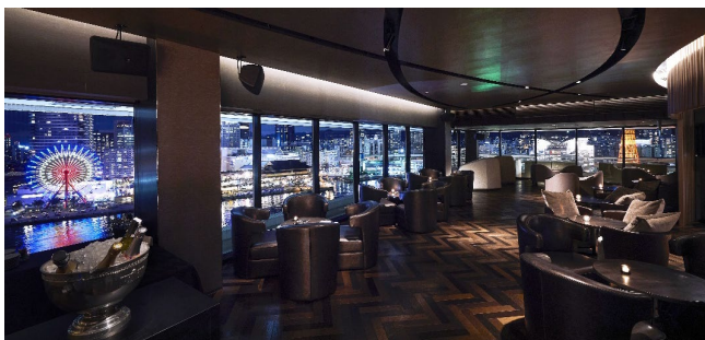
▲VIEW BAR テラス席からの夜景