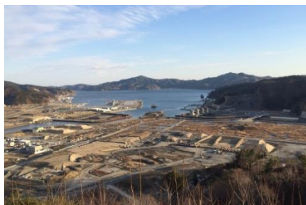
＜左上＞小学生の授業の様子 ＜中上＞中学生の授業の様子 ＜右上＞中学生のグループ自習の様子 ＜左下＞宮城県女川町の様子(2015年7月) ＜中下＞岩手県大槌町の様子(2015年1月)

新浦安は東日本大震災の際、液状化やライフラインの遮断等、少なからず影響を受け、今でもなお街には傷あとが残ります。オリエンタルホテル 東京ベイでは震災直後より地元へのお風呂提供や、東北の避難者への歯ブラシ、使い捨てカイロ等生活用品の支援、義援金や復興支援金などを通じて支援活動をしてまいりました。