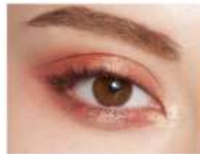
仕上がりイメージ (GD-1)