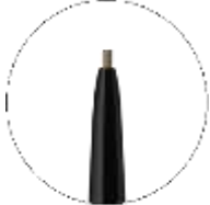
なめらかな細芯タイプ