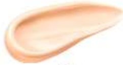
OR くすみ補整するオレンジ