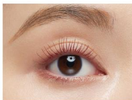
仕上がりイメージ