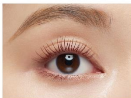
仕上がりイメージ