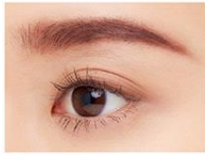
アイブロウとして使用