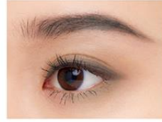
アイブロウ、アイシャドウ、 ノーズシャドウとして使用