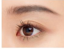
アイブロウとして使用