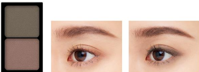
アイブロウとして使用