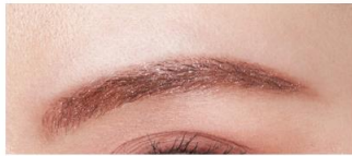
仕上がりイメージ (EX-8)