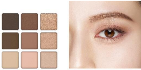
EX-5 ニュートラルブラウン系

アイシャドウのようにアイブロウメイクを楽しめるよう設計された、肌なじみの良いカラーバリエーション