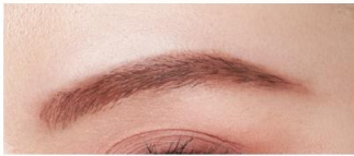
仕上がりイメージ (EX-8)