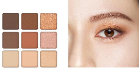
EX-6 ブラウンオレンジ系