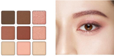
EX-8 ブラウンピンク系