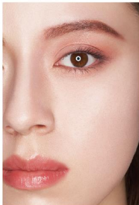
仕上がりイメージ (EX-8)