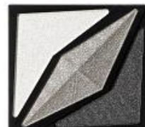
<SV-1> 洗練された スモーキーグレー