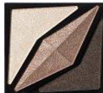
<BR-2> 落ち着いた ヌーディーブラウン