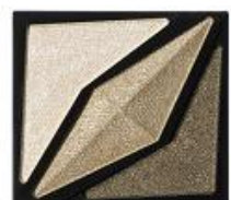
<GN-1> シックな ディープカーキ