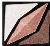
<PK-1> 柔らかな ナチュラルピンク