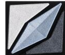
<BU-1> クールな ネイビーブルー