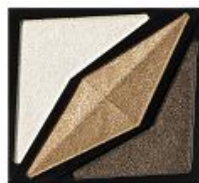
<BR-1> エレガントな 赤味ブラウン