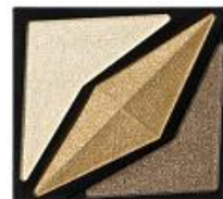
<GD-1> 華やかな シャイニーゴールド