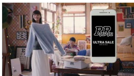
ファッションサイト RyuRyu