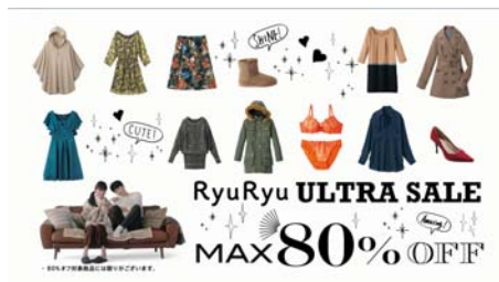
<NA> ウルトラセール！ MAX80%OFF