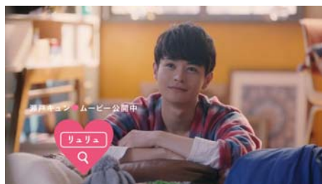
<瀬戸さん> ちゅーしたい。