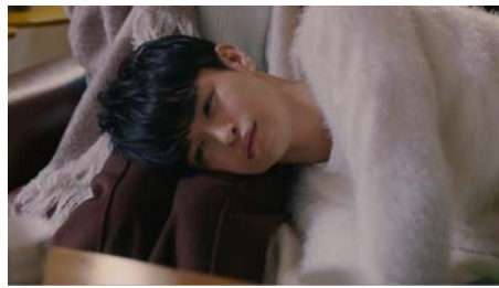
<瀬戸さん> わんっ・・・。