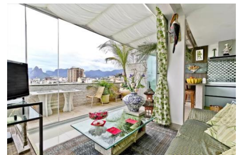
アルポアードールの中心にあるpenthouse