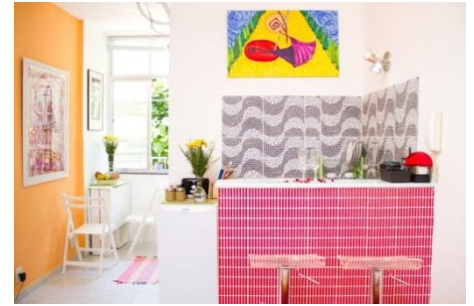
ラバの芸術的なフラット