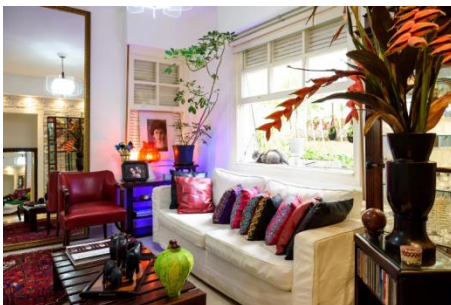
コパカバーナ・ビーチ近くのカラフルな家