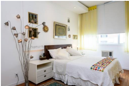
イパネマ至近の魅力的なアパート