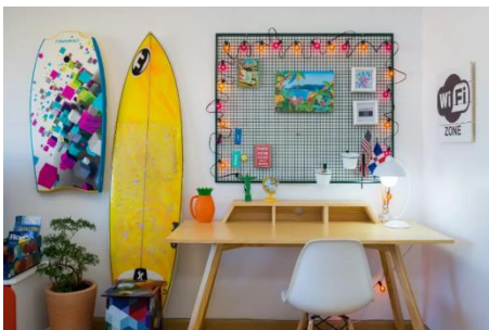
海が見える広々としたアパートメント