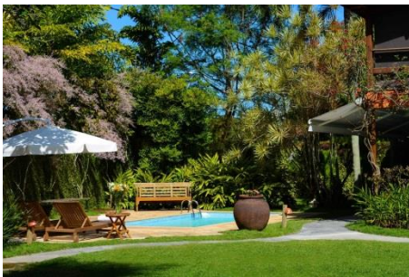
ヨアのきれいで快適なおうち