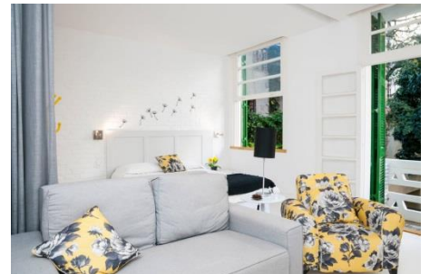
コパカバーナ中心部のデザイナーズ物件