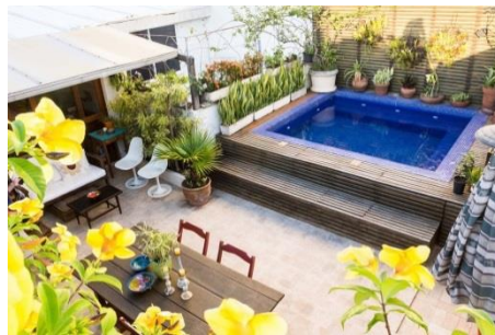
イパネマのラグジュアリーなメゾネット