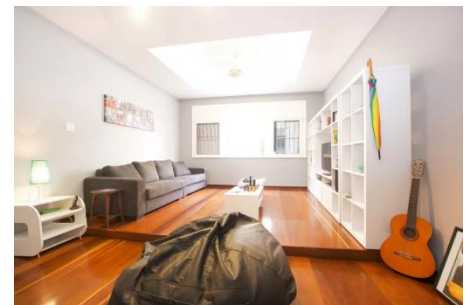
競技場すぐそば、マラカナのアパート