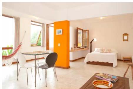
サンタテレサの緑に囲まれたスタジオ