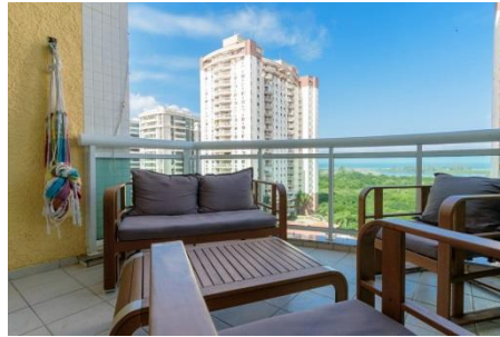
美しいラグーンを見渡す寝室