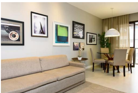
イパネマのモダンなシーサイドスイート