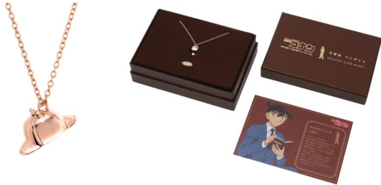
▲工藤新一モデル (イメージ画像)

名探偵コナン 名探偵ペンダント 工藤新一モデル 名探偵コナン 名探偵ペンダント 服部平次モデル 名探偵コナン ブラックペンダント ジンモデル