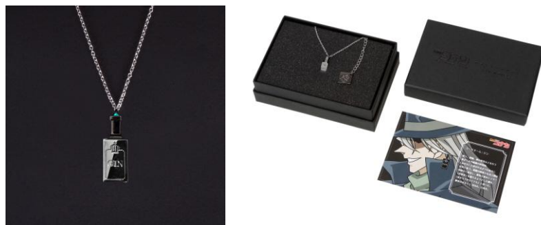
▲ジンモデル (イメージ画像)