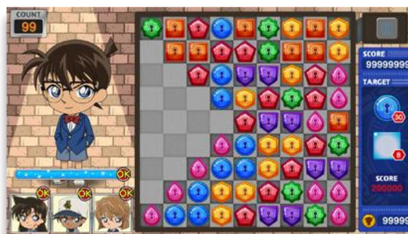
▲マイページ画面（左）、パズルステージ画面（右）