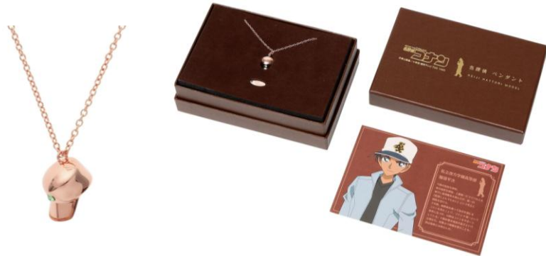
▲服部平次モデル (イメージ画像)