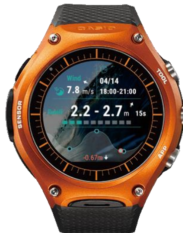
▲うねり状況、風向・風量、潮汐情報を一画面で確認できる「WSD-F10」専用仕様

現在スマートフォン向けに提供中の『なみある? アプリ』は、現地のスタッフが目視で確認した日本全国約 140 カ所にも及ぶ、各スポットの波のうねり状況、風向・風量、潮汐情報など、サーフィンや釣りなど海に出かける方に役立つ情報を提供しています。また、専属の気象予報士による丁寧な概況コメントや 48 時間先までのうねり・風の情報も確認できます。