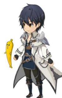
▲コラボ武器(魔道具)