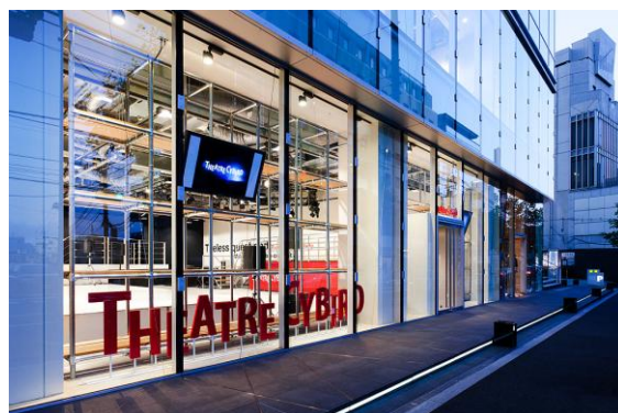
▲ オフィス1階にある“TheatreCYBIRD”では、社内表彰式・会社行事の他に、地域と一体化した様々なイベントを開催