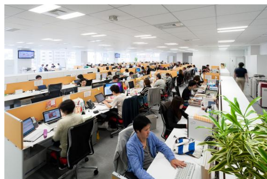
▲ 執務スペースは、遊び要素も取り入れた開放的なクリエイティブ工房として設計