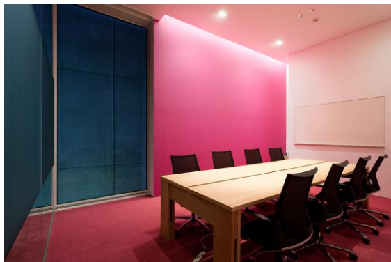
▲ 自然を基調とし、センスや驚きを演出する空間としてエントランス/会議室をデザイン