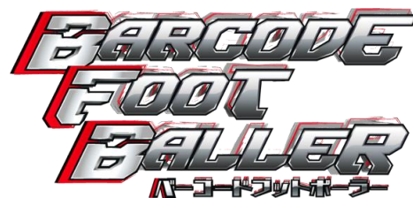
▲『バーコードフットボーラー』ロゴ