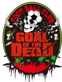
▲「ゴール・オブ・ザ・デッド」エンブレム

「第1回ゾンビ杯」の褒賞として、映画タイアップ記念の限定エンブレムを、「第1回ゾンビ杯」に参加し、勝ち点1以上を獲得された方全員にプレゼントいたします。また、「第2回ゾンビ杯」では褒賞として、映画タイアップ記念の限定ユニフォームを、「第2回ゾンビ杯」に参加し、勝ち点1以上を獲得された方全員にプレゼントいたします。