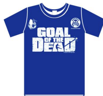
▲「ゴール・オブ・ザ・デッド」ユニフォーム