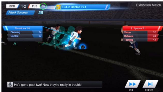
▲カットインドリブル発動シーン