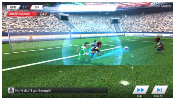
▲スーパークリア発動シーン