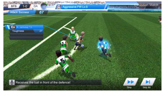
▲アグレッシブFW発動シーン