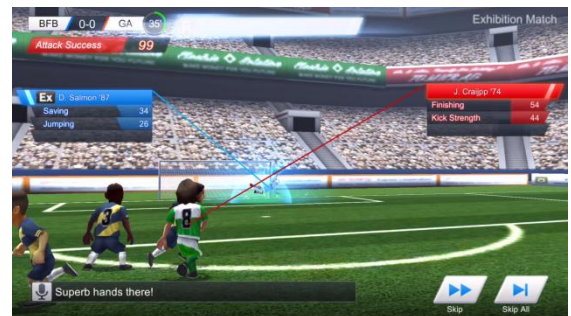
▲パンチング発動シーン