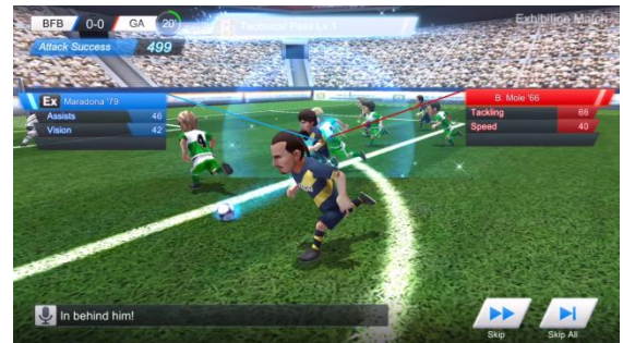
▲テクニカルパス発動シーン