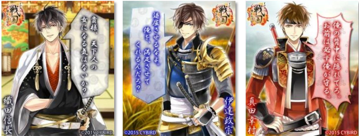
▲キャラクターのフキダシにセリフを入れて送ることができるコマ (サンプル画像)