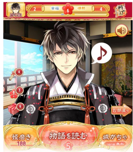
▲「彼部屋」イメージ画像