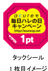
タックシール 1枚目イメージ