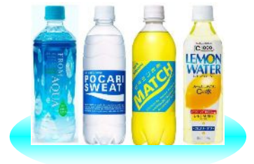
対象商品 (acureお勧めの飲料)