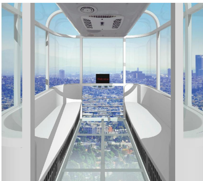
ゴンドラ(定員6名)イメージ