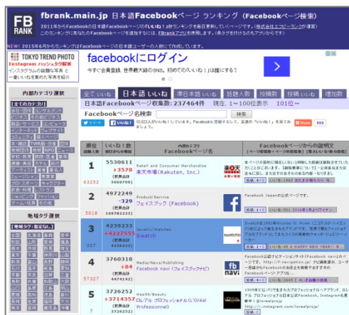
国内最大級のFacebookページ ランキングサイト「Fbrank」

エフビーランクは、ヒトメディア・グループの一員としてソーシャルメディア上のビッグデータを分析し、リアルタイム制の高いトレンド情報を提供できる次世代のデータアナリシス・コンサルティング企業を目指してまいります。