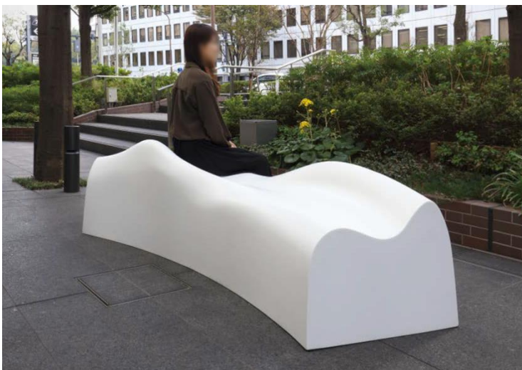
屋外での設置が可能