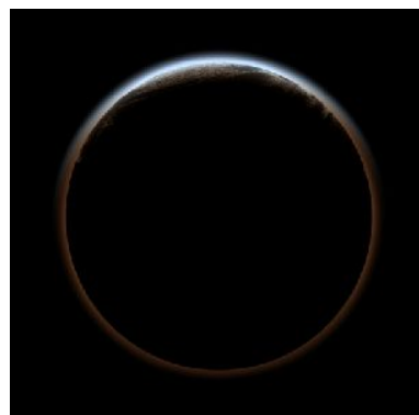
金環日食のイメージ図

今回発売される記念モデルには、18石のダイヤモンドが施され、永続的な想いが込められています。太陽と地球と月は約18年の周期で、ほぼ同じ位置に来るとされており、ある日食から約18年後には地球上のどこかで*1 ほぼ同条件の日食が起こります。これをサロス周期といいます。例えば、今回の2012年5月から18年後の2030年6月には北海道で同じような金環日食が、2014年10月に起こるシベリア～北米の部分日食から18年後の2032年11月にはユーラシア大陸で同じような部分日食が見られるそうです。ベイリービーズ 18LD は、このサロス周期にあやかり18石のメレダイヤモンドをセッティングしました。18石のメレダイヤには、18年毎にご結婚されたときの幸せな気持ちを思い出して、絆を深めていただきたい、そんな想いが込められています。