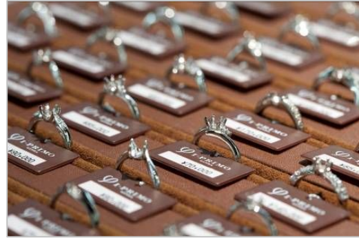
多彩なデザインバリエーションよりチョイス