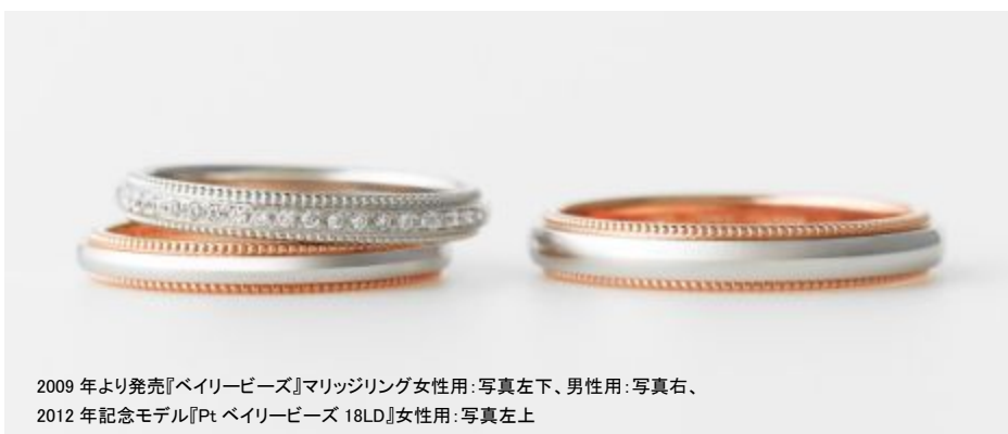
2009年より発売『ベイリービーズ』マリッジリング女性用:写真左下、男性用:写真右、 2012年記念モデル『Pt ベイリービーズ 18LD』女性用:写真左上

プリモ・ジャパン株式会社(本社:東京都中央区、代表:澤野直樹)が運営するブライダルリング専門店「アイプリモ」は、2012年5月21日の金環日食を記念して、2009年に発売されたマリッジリング「ベイリービーズ」の記念モデル「Pt ベイリービーズ 18LD」を4月28日(土)より発売いたします。