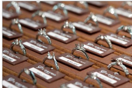
多彩なデザインバリエーションよりチョイス