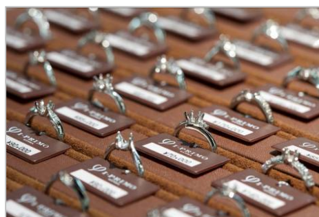
多彩なデザインバリエーションよりチョイス