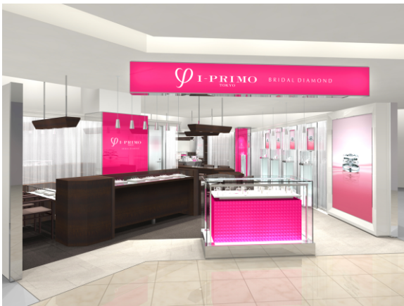
■ アイプリモ SOGO 新竹 Big City 店外観イメージ 1