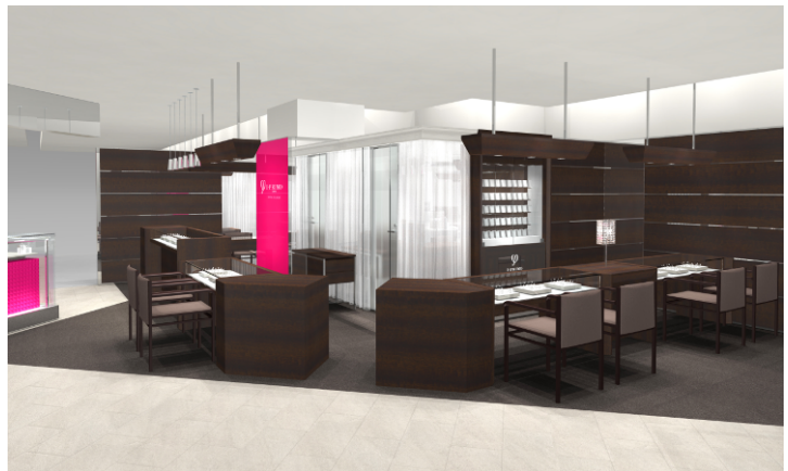
■ アイプリモ SOGO 新竹 Big City 店外観イメージ 2