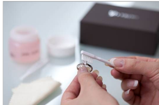
充実のアフターケアで大切な指輪を末永く身に着けられます