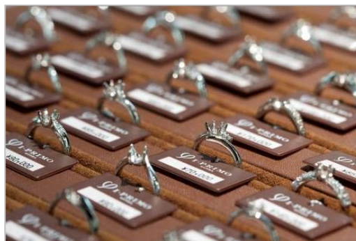
多彩なデザインバリエーションよりチョイス