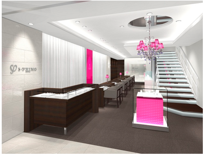
■ アイプリモ静岡本店内観イメージ

今回のリニューアルでは入口に全長4メートルのハイカウンターを設置し、その中にはアイプリモの象徴的な商品を陳列。接客ブースにご案内する前に、ブライダル専門店ならではの特長を感じて頂くことを目的としています。また、従来の店舗レイアウトでは、婚約指輪と結婚指輪のサンプルを分けた接客ブースを設けていましたが、婚約指輪と結婚指輪の同時に購入されるお客様の更なる増加を目的とし、同時に商品が選べるよう1つの接客ブースに婚約指輪と結婚指輪のサンプルを設置するスタイルを導入します。今後このスタイルが定着すれば、同様の店舗モデルを展開していく予定です。