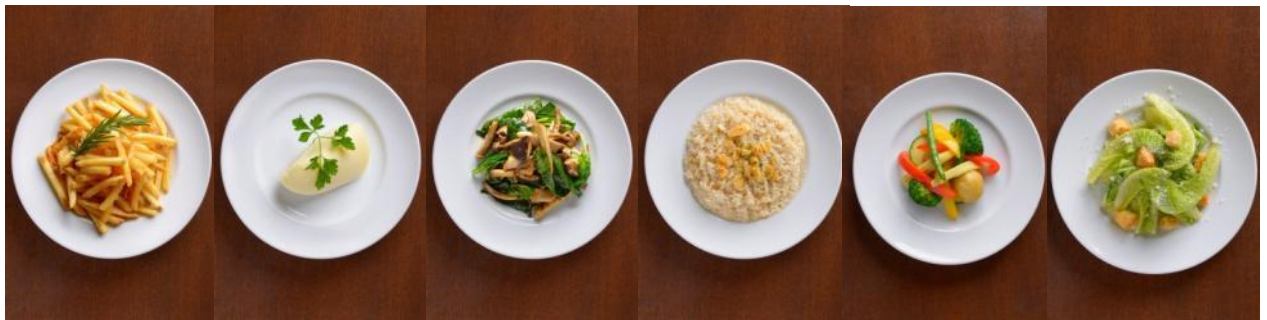
フレンチフライ マッシュポテト 納豆の草とキノコ炒め ガーリックラス スチームベジタブル シーザーサラダ