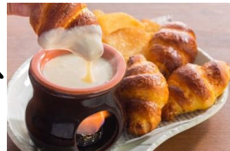
【クロっち！フォンデュ】