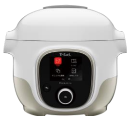
電気圧力鍋「クックフォーミー」