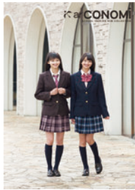
レディースカタログ