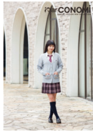
アイテムカタログ