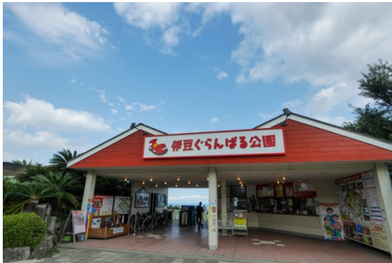
【伊豆ぐらんぱる公園 入園受付】