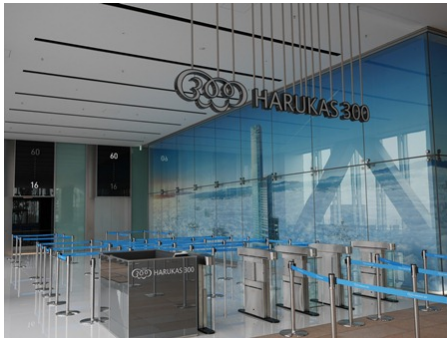
【ハルカス300(展望台) 入場ゲート】