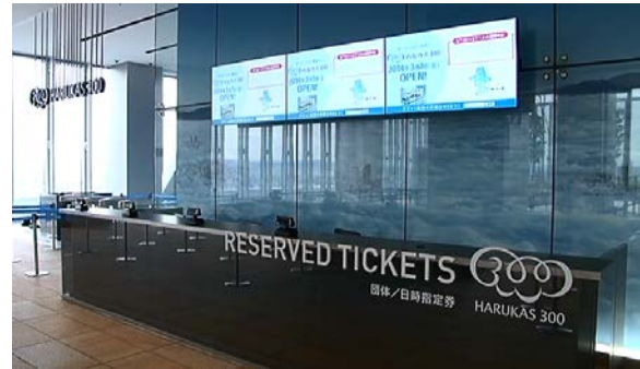
【ハルカス300(展望台) チケットカウンター】

パナソニック インフォメーションシステムズ株式会社(本社:大阪市北区 代表取締役社長:前川 一博 以下:パナソニックIS)は、あべのハルカス(所在地:大阪市阿倍野区)に3月7日開業した「ハルカス300(展望台)」および3月22日に開館する「あべのハルカス美術館」のチケットングシステムをクラウドサービスで提供いたします。