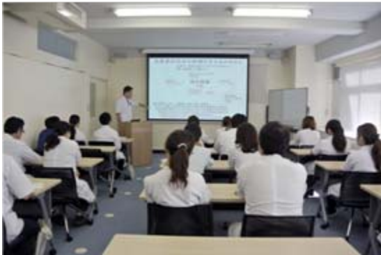
【神奈川歯科大学大学院 ICT講義室】