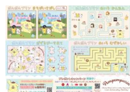
ポムポムプリン「うら」