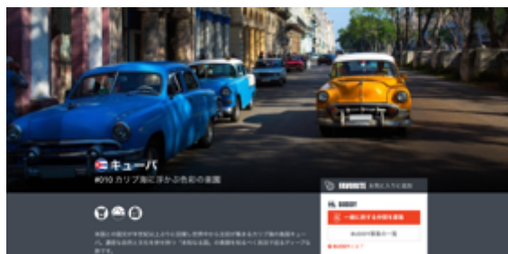
<「TRAVEL PLANET」掲載記事ページ例>

「TRAVEL PLANET」に掲載している全てのプランが BUDDY システムの対象となります。行きたいプランの記事を選び、『一緒に旅する仲間を探す』ボタンをクリックすると、BUDDY システムを利用することができます。