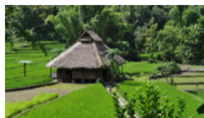
メコン川の船旅で少数民族の村へ (ラオス)