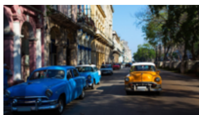
カリブ海に浮かぶ色彩の楽園 (キューバ)