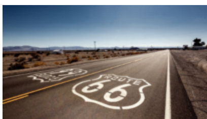
モーターホームで旅する「ROUTE66」 (アメリカ)