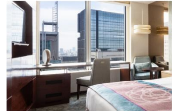
▲ホテルメトロポリタン 丸の内

<参考> STATION WORK WEB サイト ( https://www.stationwork.jp/ )