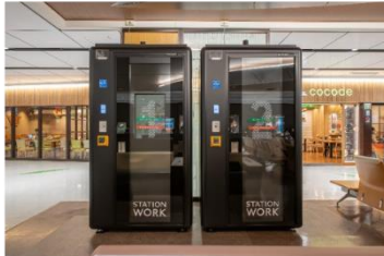
▲ STATION BOOTH仙台(新幹線改札内)