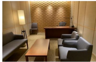
▲STATION DESK 東京 premium 応接室