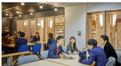
コインスペース 渋谷マークシティ店

※3 STATION WORK 専用 WEB サイトの予約ページに記載がございますのでご確認ください。