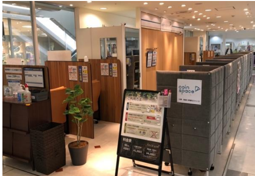
コインスペース 水戸エクセル店