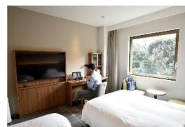
▲ホテルメッツ目白