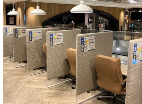
コインスペース 三宮オーパ2店