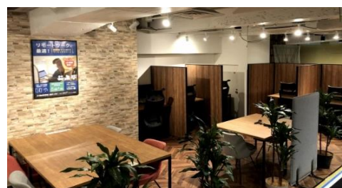
コインスペース グランデュオ蒲田店[西館 M2 階]