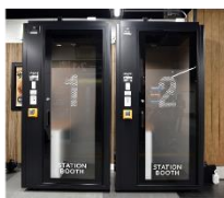
▲ STATION BOOTH