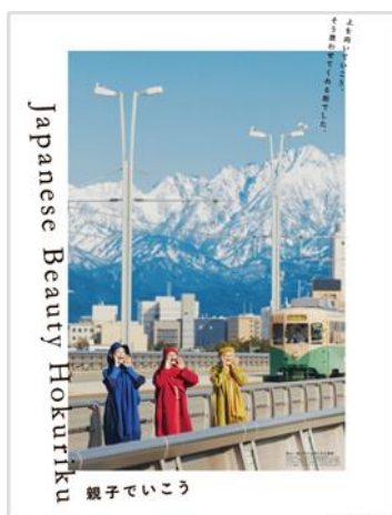
撮影地：富山県（富山市）