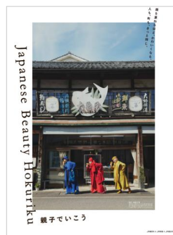
撮影地：福井県（大野市）