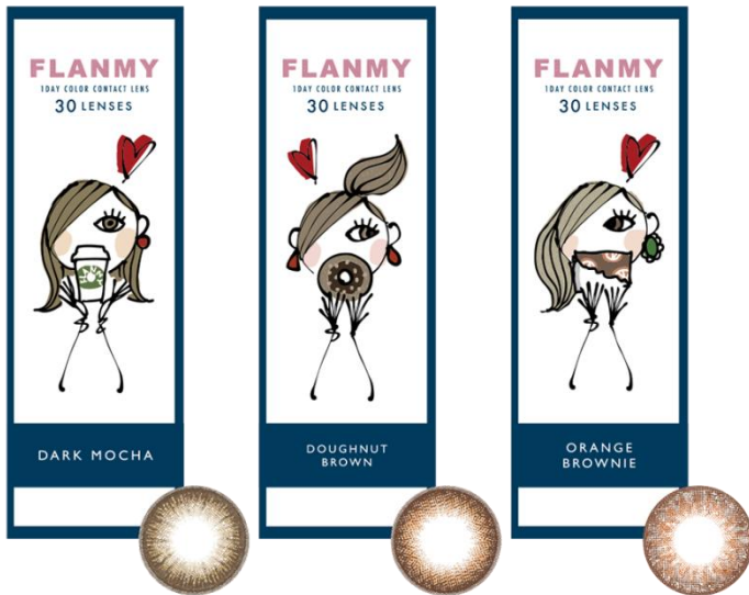
DARK MOCHA DOUGHNUT BROWN ORANGE BROWNIE ダークモカ ドーナツブラウン オレンジブラウニー