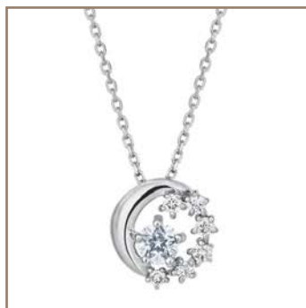
Pt900/Wish upon a starダイヤモンド 0.13ct 108,000円