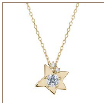
K10YG/Wish upon a starダイヤモンド 0.1ct 41,040円