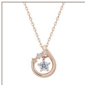
K18PG/Wish upon a starダイヤモンド 0.08ct 62,640円