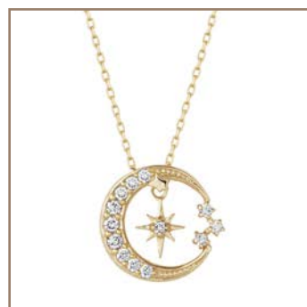
K10YG/ダイヤモンド 0.07ct/ルビー 30,240円