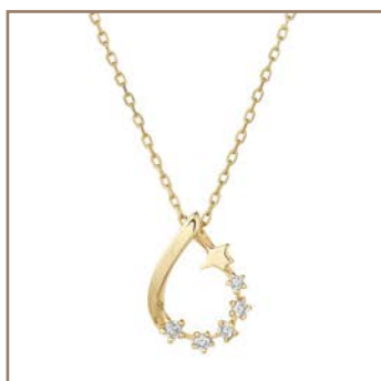
K10YG/ダイヤモンド 0.02ct 19,440円