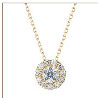
K18YG/Wish upon a starダイヤモンド 0.25ct/ルビー 162,000円