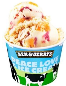
【先行発売する 新フレーバー】

今後もBEN&JERRY'Sでは、地元の皆様に愛されるショップづくりにじっくりと取り組みながら、新店舗を展開していく予定です。