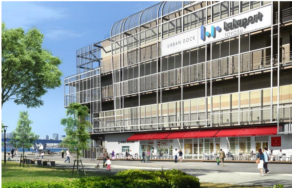
※フードコート外観 テラス席イメージ

客席は明るいウッド系で、カウンター席、ビッグテーブル席、一般席、キッズ同伴席など様々なニーズに対応できる客席で構成されています。また、ショッピングの合間にほっとできるカフェ利用も想定したテラス席に加えて、キッズ同伴席に隣接してキッズプレイエリアも設置し、食事だけでなく遊びの要素も取り入れた空間となっています。