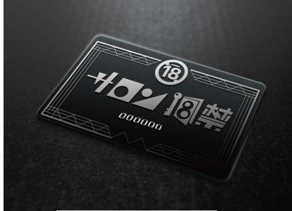
▲正会員証デザイン